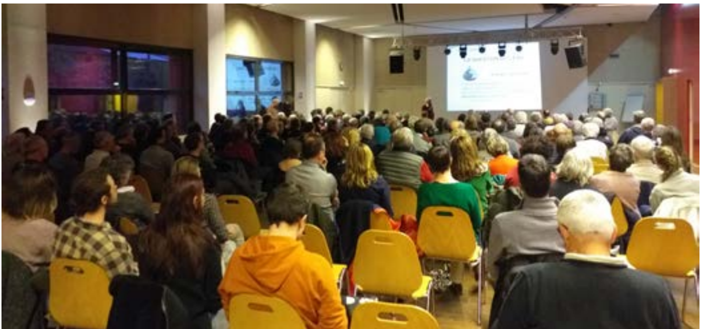
Conférence sur l'Eau organisée par CAP, Crolles le 3 avril 2023

Jeudi 21 mars 2024 20h, salle l'Atelier Venez échanger sur le bilan de mi-mandat et notre ambition partagée pour Crolles