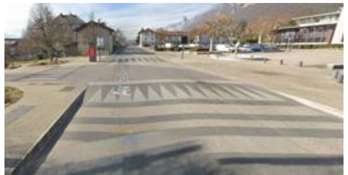
Un centre de ville si peu convivial ...

N'attendons pas obligation et contrainte pour changer. Écrivons ensemble notre avenir ! Choisissons le !